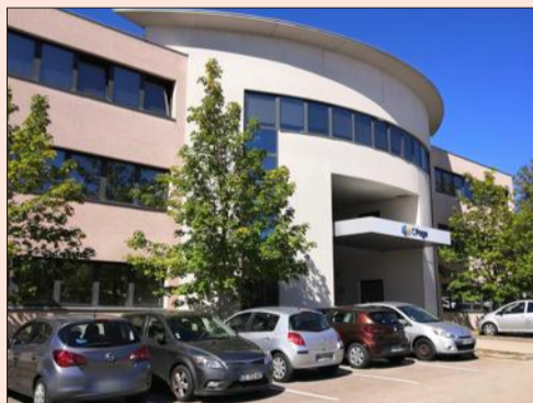
Les locaux actuels de CPage, au 19, rue de Broglie à Dijon, sont destinés à être vendus.

L'histoire de CPage commence il y a près de 40 ans, boulevard Jeanne-d'Arc, au CHU de Dijon. À l'origine, ce service informatique du centre hospitalier commence à s'étendre et à faire profiter de ces outils de développement de solutions administratives les établissements du département, puis de la région ; de fil en aiguille, elle prend la forme juridique de différentes structures ; en 2002, celle d'un groupement d'intérêt public. Au début des années 2000, CPage, qui compte environ 80 salariés, quitte le CHU pour s'installer dans de nouveaux locaux, au 19, rue de Broglie, dans le parc technologique de Dijon, où l'entreprise ne cessera de croître, avec deux extensions, en 2013 et en 2018, jusqu'à tripler ses effectifs.