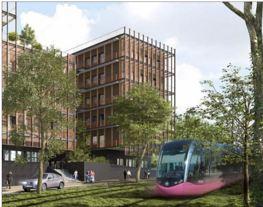
CPage va s'installer dans l'immeuble Spicy (droite), desservi par le tramway. Visuel Patriarche